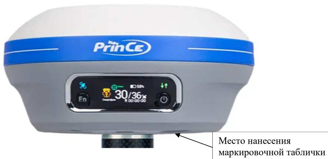
Рисунок 1 – Общий вид аппаратуры геодезической спутниковой PrinCe i80

Общий вид маркировочной таблички представлен на рисунке 2.