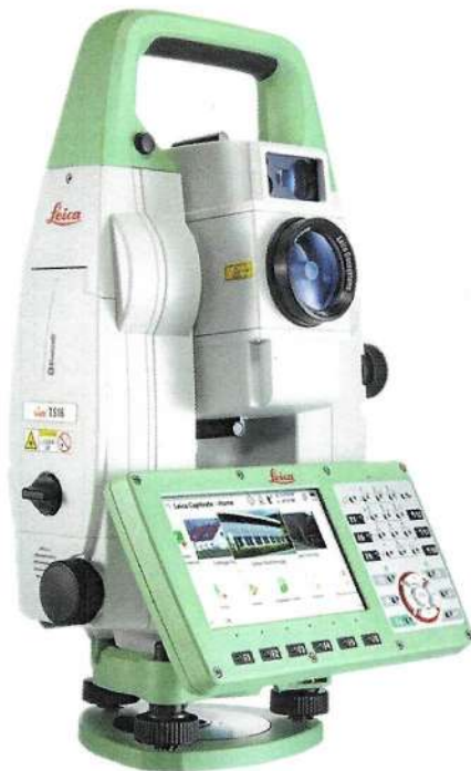
Рисунок 1 – Общий вид тахеометров электронных серий Leica TS16 P Arctic и Leica TS 16 G

Общий вид тахеометров представлен на рисунках 1-2.