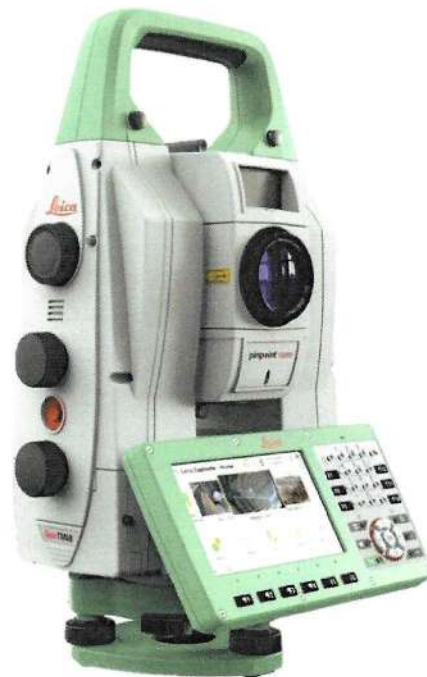
Рисунок 2 – Общий вид тахеометров электронных серий Leica TM60